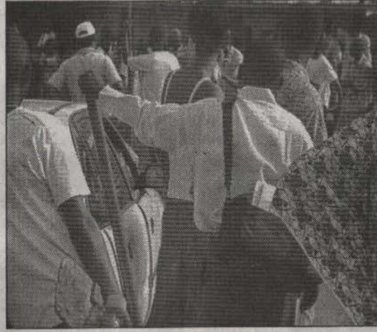
❷ On tente de les maîtriser tout en évitant de faire d'envenimer la situation.