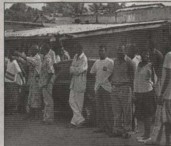
❸ Les bras tendus, cet habitant venu écouter le BDP ne comprend pas ce qui arrive. Mais, paraît regretter que son meeting soit ainsi perturbé.

O N se serait cru en pleine scène de violences de rue des années 90 ! A peine commencé, le meeting du BDP au petit marché de Kinguélé (1/12), un jeune homme fonce d'un pas décidé sur le public assis sous une tente. Vociférant, il donne des coups de pieds aux chaises en tentant de les briser. « Nous ne voulons pas de vos histoires ici. Enlevez tout ça : Partez ! ». Il est rejoint par deux autres hurluberlus en état d'ébriété notoire. Ils renversent les chaises et démontent la tente. Panique chez les organisateurs du meeting qui mettent la sono et les autres