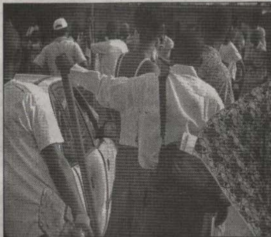
❷ On tente de les maîtriser tout en évitant de faire d'envenimer la situation.